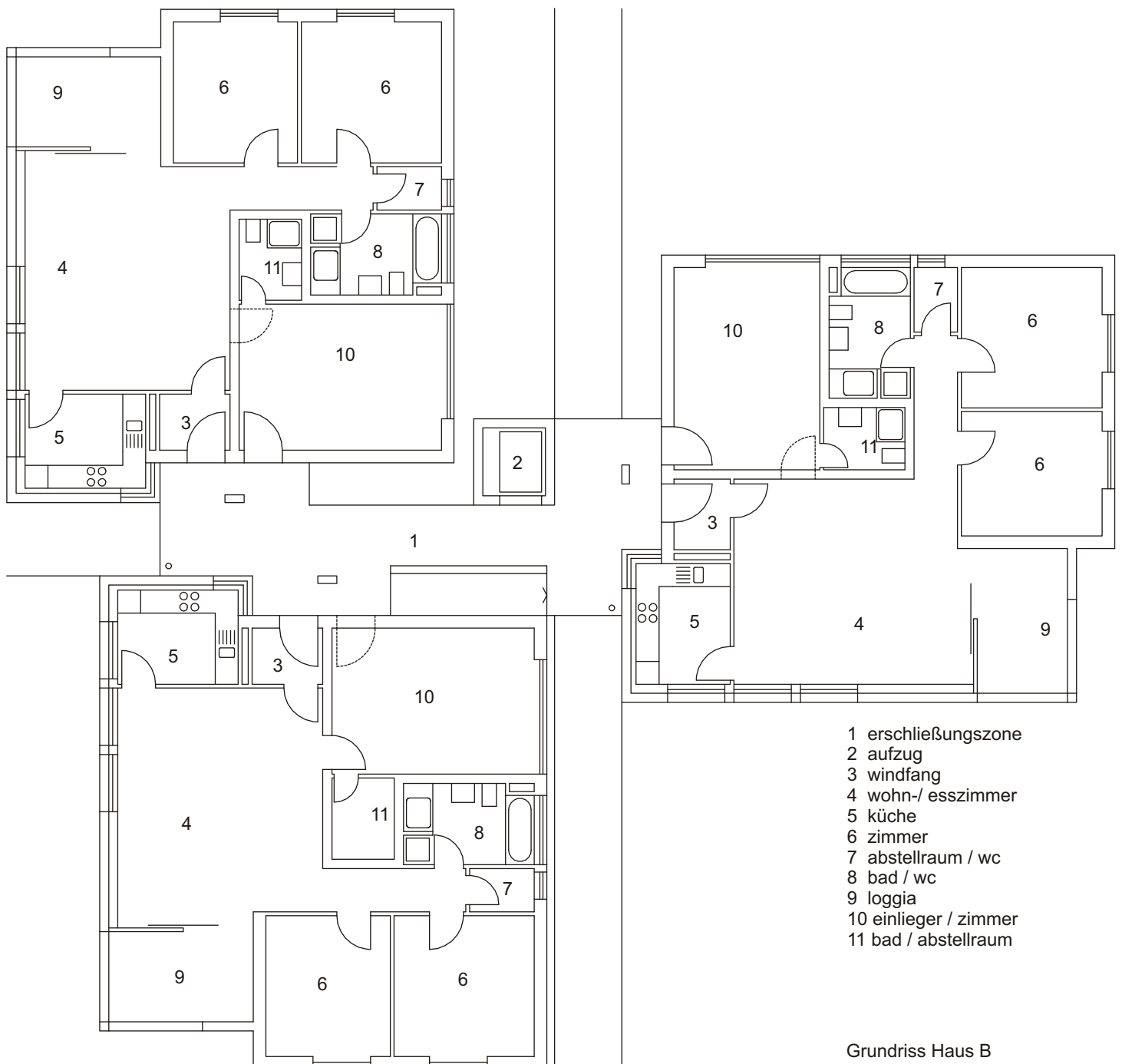
Grundriss Haus B

neubau von vier wohngebäuden mit tiefgarage im quartier zwischen schülinstrasse und friedensstraße, 89073 ulm